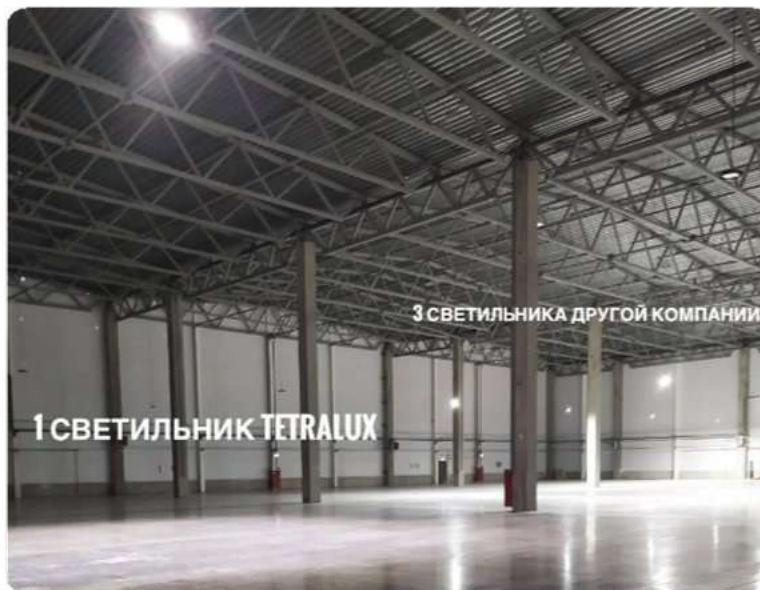
Складской светильник LTP на тест-драйве будущего заказчика – производителя спецодежды

На тестирование мы отправляли складские светильники LTP 110/14850/60/482 с глубоким типом КСС. Они светили ярче «конкурентов» и показали лучшую энергоэффективность. Поэтому дальше клиент заказал у нас освещение всего объекта.