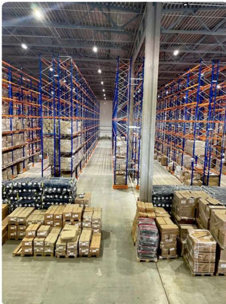
Освещение склада в новом здании заказчика